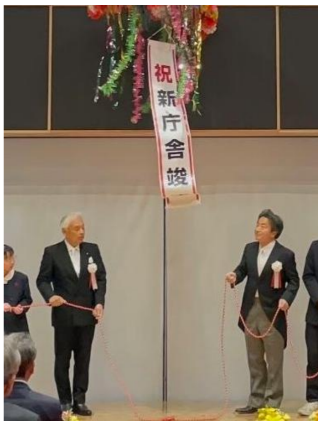
▲令和7年3月9日 新庁舎竣工式

総社市議会議長としての約3年半務めさせていただき、多くの貴重な経験をさせていただきました。