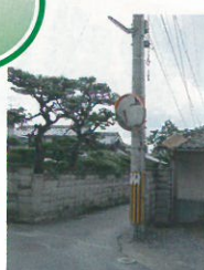
カーブミラーが つけました。

えっ!? こんな所が通学路? 車輛1台がやっとの道幅。子供たちの安全を考えて通学路の改善を!