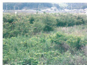
荒れ放題の紀文誘致予定地(左)