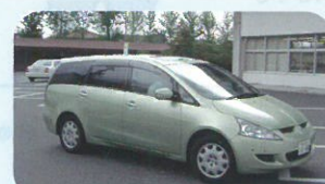
平成16年6月定例会市議会で「三菱地 元取引企業支援」を訴えました。公 務はもちろん三菱車です。