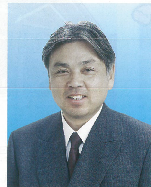
大好きな総社市のために頑張ります

平成17年3月22日、総社市・山手村・清音村の合併により新「総社市」が誕生しました!! 現在、在任特例の適用で新総社市の議席数が43になっています。これは人口が約7倍の倉敷市と同数です!そのことが総社市にとって、どのような利益をもたらすといえるのでしょうか!?