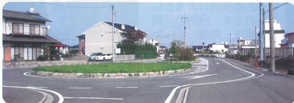
JR吉備線東総社駅北側風景