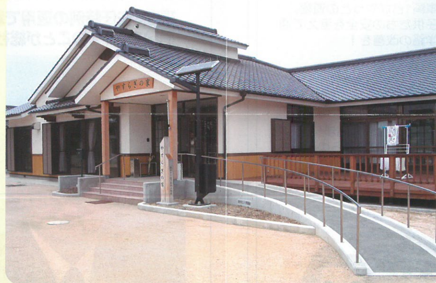
平成16年4月7日 総社市介護予防拠点施設 やすらぎの家 竣工