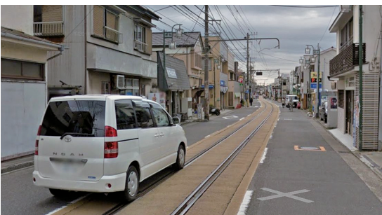
軌道の上を車両が走行 (江ノ島電鉄)