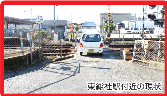
東総社駅付近の現状