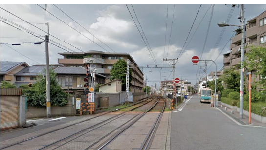
広々とした踏切 (阪堺電軌上町線)