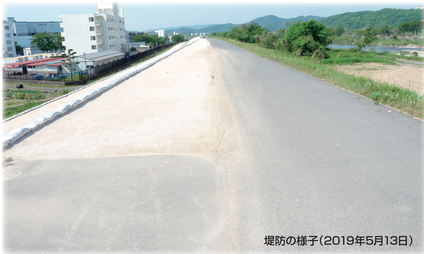
堤防の様子(2019年5月13日)

平成29年から着工した堤防補強工事(湛井堰から南へ400m部分、1年に100mずつ4年間の工事を予定)が完了しました。予定より約2年早い竣工となりました。