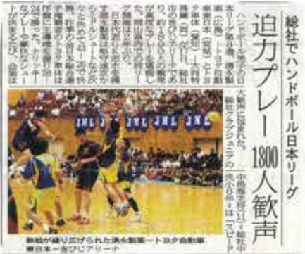
H24.9.18付 山陽新聞記事より

・全国発信し交流人口を増やせる施設として活用しやすくしよう。メンテナンスをしっかり整備して… KCTカップ・日本ハンドボールリーグ総社大会 など