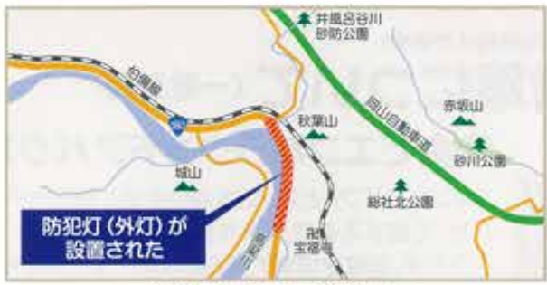
国道180号 瀬井堰～明治橋区間

ここは昼間でも暗く大変危険な場所がある区間です。法律でトンネル・橋にはつけることができませんが、可能な場所には設置しました。