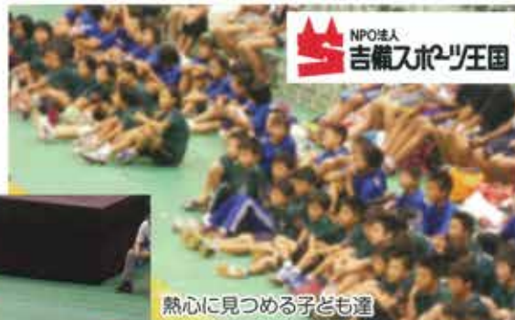
熱心に見つめる子ども達