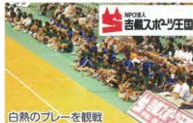
白熱のプレーを観戦