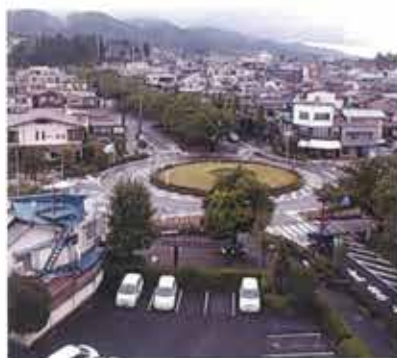
長野県飯田市のラウンドアバウト