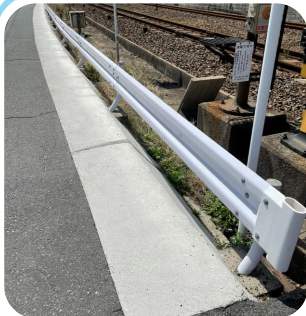
伯備線 法面工事 完成