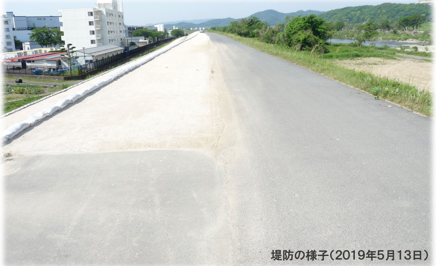
堤防の様子(2019年5月13日)

平成29年から着工した堤防補強工事(湛井堰から南へ400m部分、1年に100mずつ4年間の工事を予定)が完了しました。予定より約2年早い竣工となりました。