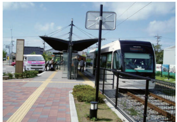
ホームを挟んでLRTとバスが連絡を取り合う